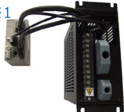
リニューアル製品 HR-MASTER 概観